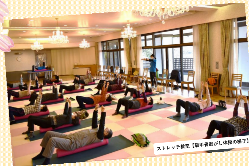
ストレッチ教室【肩甲骨割がし体操の様子】