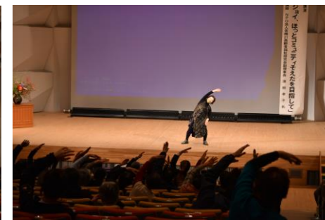
(写真)認知症予防体操の様子