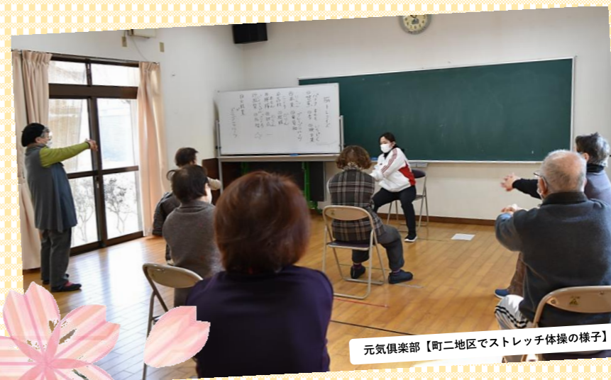
元気倶楽部【町二地区でストレッチ体操の様子】