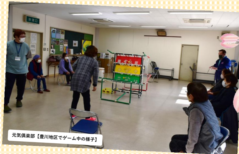
元気倶楽部【豊川地区でゲーム中の様子】